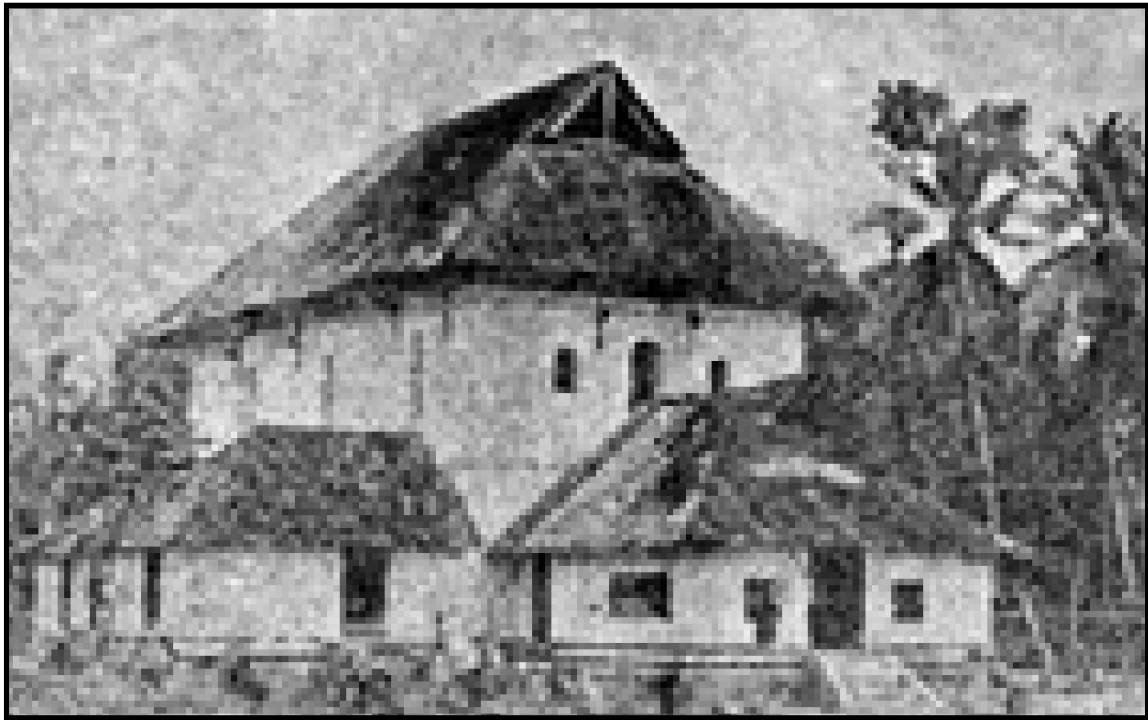
ചേരമാൻ പള്ളി (1950കളിൽ)