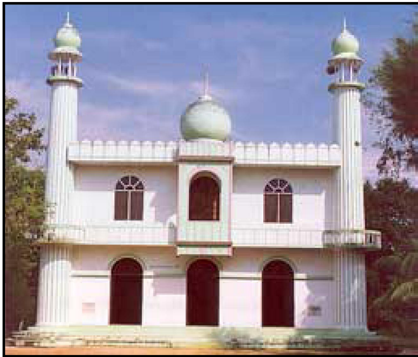
1984ൽ പുതുക്കിപ്പണിതതിനു ശേഷം